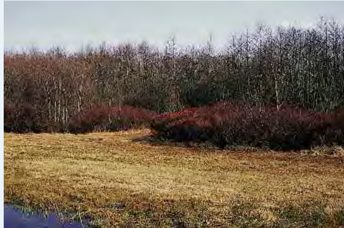
Foto 1. Bloeiend gagel in het veenheidegebied.

Aan het eind van de Middeleeuwen begon men met de ontginning van woeste veengronden. Eerst ten behoeve van de akkerbouw en veeteelt, later ook voor de winning van turf. Het ontginnen gebeurde systematisch. Het leverde een karakteristiek landschap op bestaande uit langgerekte evenwijdige percelen. Deze percelen werden doorsneden door vele parallel lopende sloten en werden duidelijk afgebakend door wateringen en kades. Deze landschappen worden de slagenlandschappen genoemd, afgeleid van het middeleeuwse woord 'slaan', dat betrekking had op het verdelen van onontgonnen gebieden.