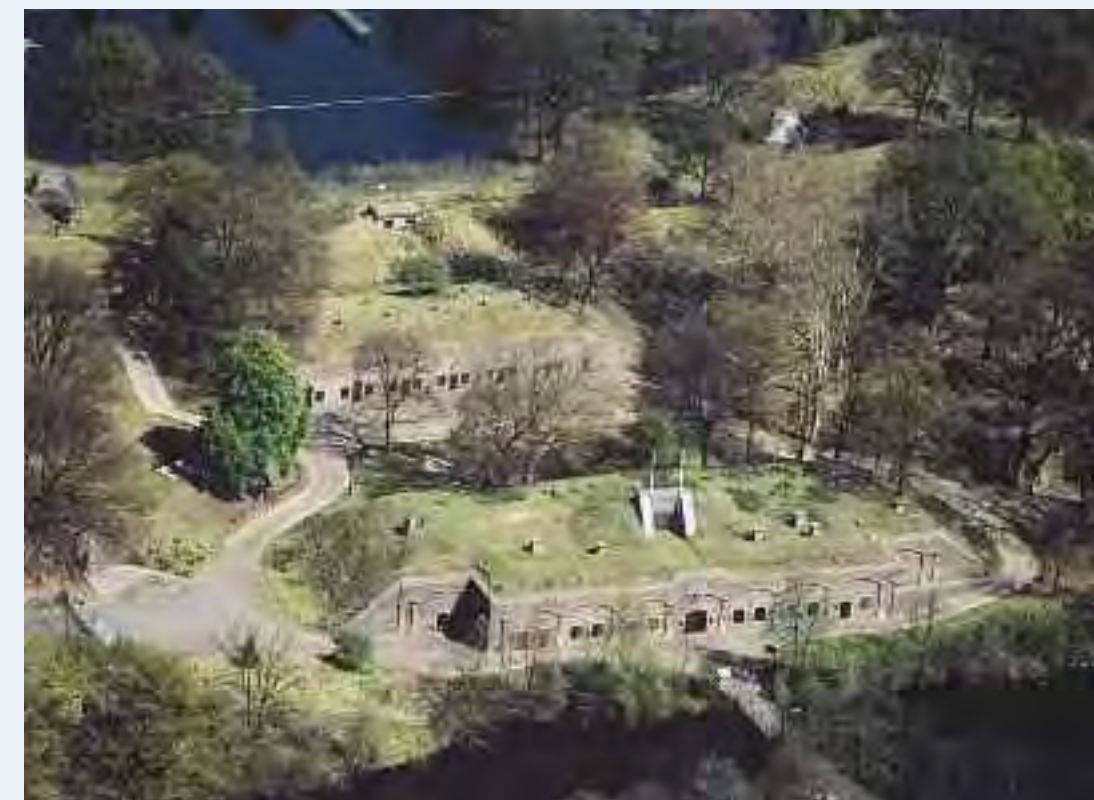
Foto 2. Fort op de Ruigenhoekse Dijk.

Fort op de Ruigenhoekse Dijk (1869-1870), in eigendom van Staatsbosbeheer, heeft een vierkante vorm met in elke hoek een toren. Het sloot de dijkwegen, tevens inundatiekaden, af. Ook de weg en de spoorlijn Utrecht - Hilversum lagen binnen bereik van het geschut. Rondom het fort worden dikwijls broedvogels als de bosuil, de grote bonte specht, de blauwe reiger en de ijsvogel aangetroffen. Doordat er zand op de gebouwen ligt, afkomstig uit de fortgracht, is het een "eilandje" van zandgrond in het veengebied, wat een aantal bijzondere plantensoorten oplevert, zoals koningskaars en zwarte toorts.